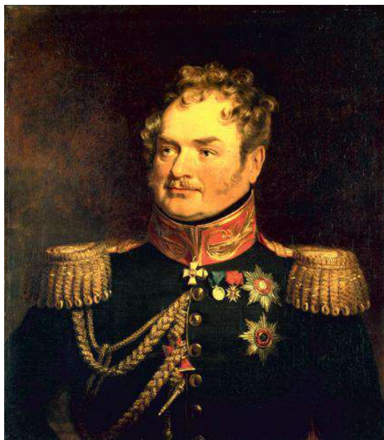
George Dawe (1781–1829): Portret Karla Osipowicza Lamberta. W zbiorach galerii wojskowej Ermitażu w Pałacu Zimowym w Petersburgu.