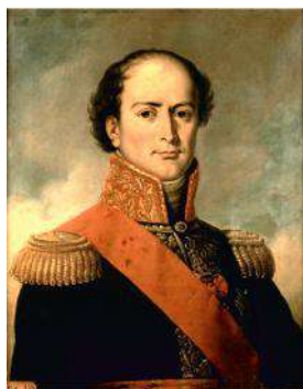
Jean-Baptiste Paulin Guérin (1783–1855): Jean-Baptiste Éblé. W zbiorach Musée de l'Armée w Hotelu Inwalidów w Paryżu.